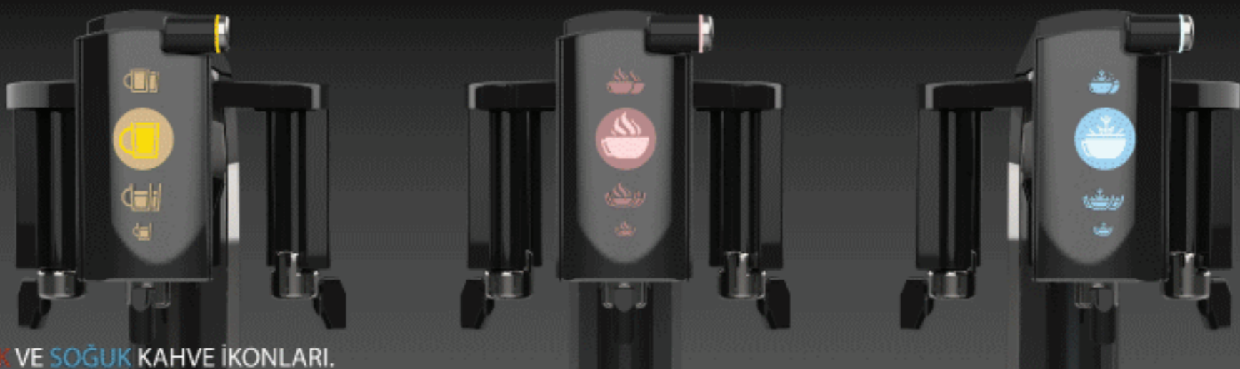
SIRASIYLA ESPRESSO, SICAK VE SOĞUK KAHVE İKONLARI.